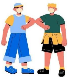
Toque no cotovelo

Existem muitas formas, até divertidas para o aluno (a) cumprimentar seus colegas e evitar a transmissão do vírus: