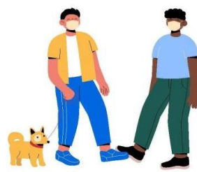
Toque com os pés