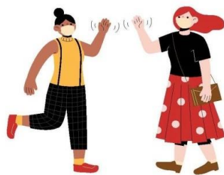
Acene com as mãos